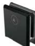
1274000NE Conector con base chica y un tornillo de fijación.