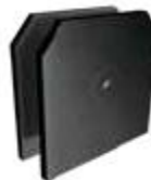
1145000NE Conector Ajusco de 1-3/4" de fijación central.