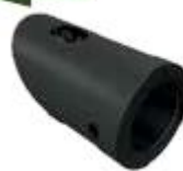
1240004NE Conector Fijo A 45° Muro-Tubo.