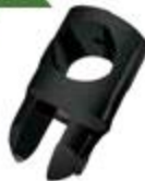
1240003NE Conector Fijo Con Atrape Vidrio-Tubo.