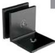
1106000NE Conector recto Tepozotlán con base lateral a 90°.