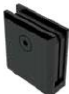
1144000NE Conector de 2" para fijos de vidrio templado.