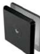
1266000NE Conector recto muro a vidrio base chica.