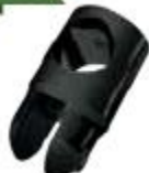
1240007NE Conector Vidrio-Tubo Ajustable Con Atrape Movil 19mm.