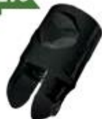
1240002NE Conector Ajustable Con Atrape Vid-Tubo.