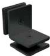
1161090NE Conector recto Insurgentes vidrio a vidrio 90°.