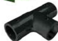
1240010NE Conector Tipo T Tubo a Tubo de 19 mm.