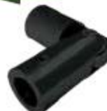
1240005NE Conector Ajustable Tubo-Tubo De 90-180°.