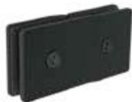
1161180NE Conector recto Insurgentes vidrio a vidrio 180°.