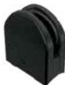
1191000NE Conector grapa Bucerías base curva para tubo de 2" sin resaque en cristal.